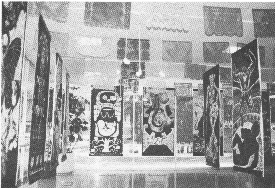
Perspectiva de la exposición.

Así sucedió en la ESIA-Tecamachalco, donde se realizó un festín visual con huesitos y huesotes gracias a las 21 xilografías que mostraron los artistas de dicho taller e