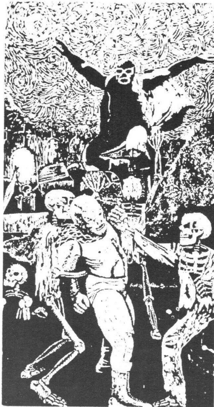
"El Santo y Blue Demón contra las calacas" Octavio Leonel Ramírez Olvera