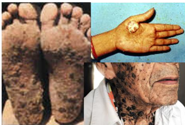
Fig. 2 Hiperqueratosis e hiperpigmentación

arsénico inorgánico puede aumentar el riesgo de cáncer de la piel y de cáncer del hígado, la vejiga y los pulmones; su inhalación puede desencadenar cáncer en pulmón (Lauwerys, 1988).