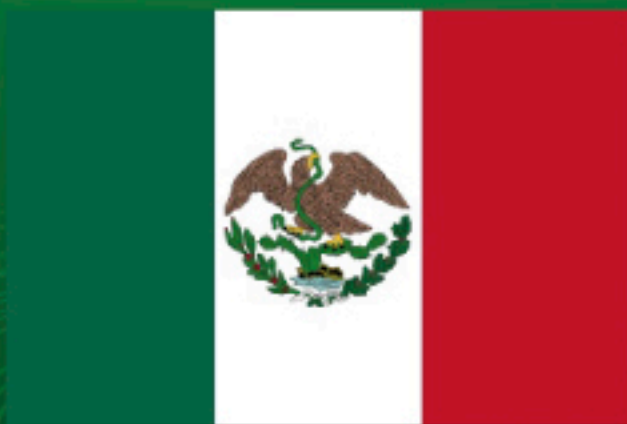
Segunda Bandera Nacional