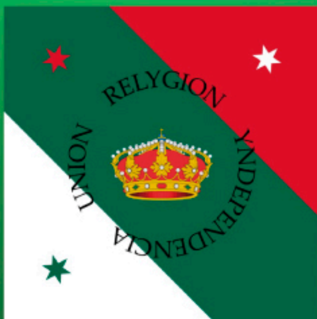
Primera Bandera Nacional