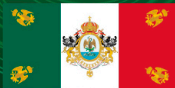
Tercera Bandera Nacional