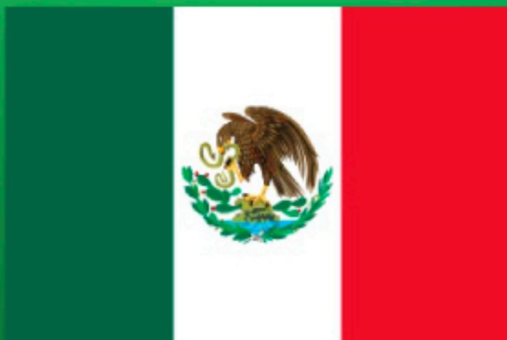
Bandera Nacional utilizada por Venustiano Carranza