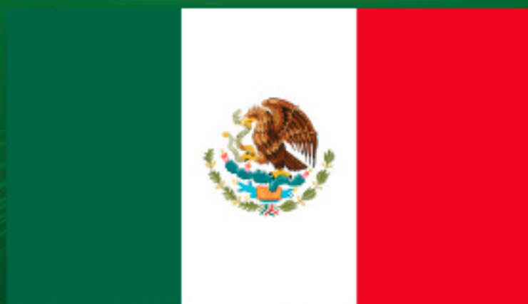
Bandera Nacional actual, utilizada desde 1968