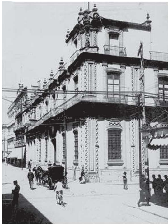
Casa de los Condes de San Mateo Valparaíso.