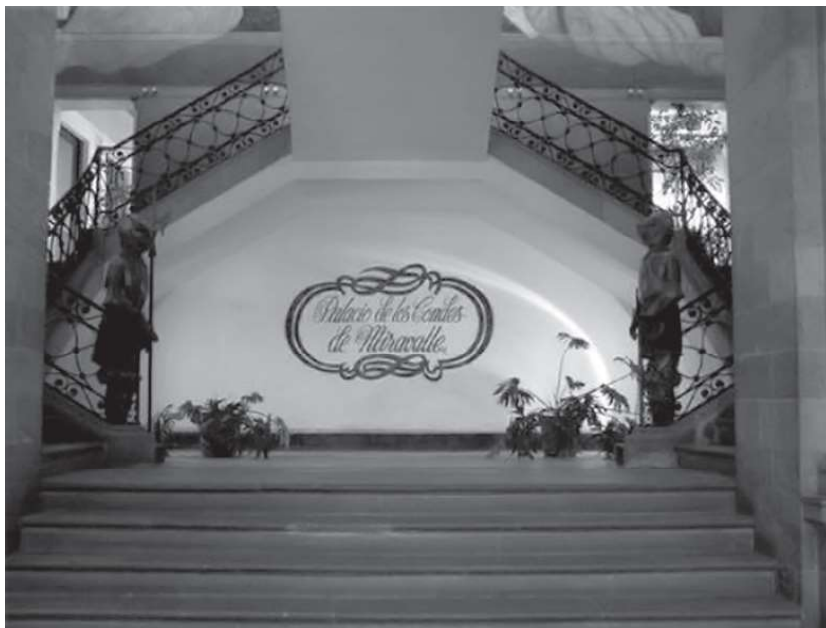
Detalle, casa de los Condes de Miravalle.