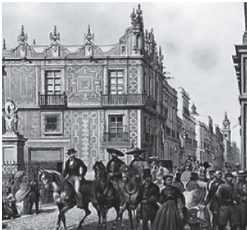
Casa del Conde del Valle de Orizaba, o casa de los Azulejos.