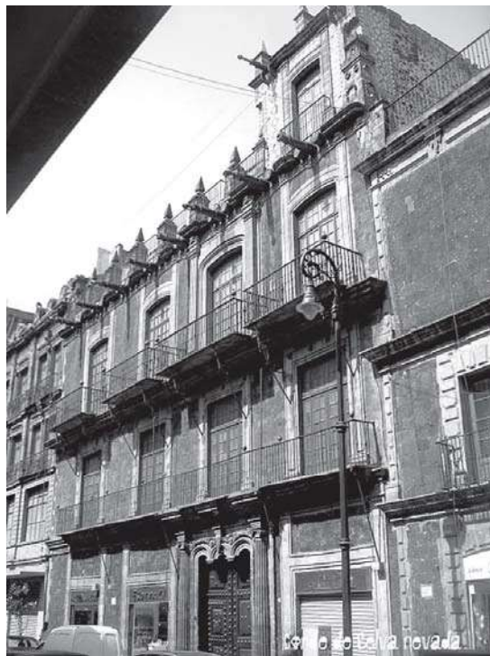
Actual Casa del Conde de la Torre Cosío.