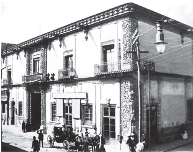
Casa de los Condes de Heras y Soto, hoy Archivo Histórico del Distrito Federal.