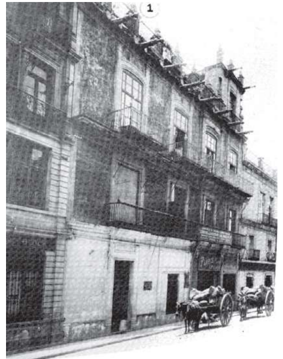
Casa del Conde de la Torre Cosío.