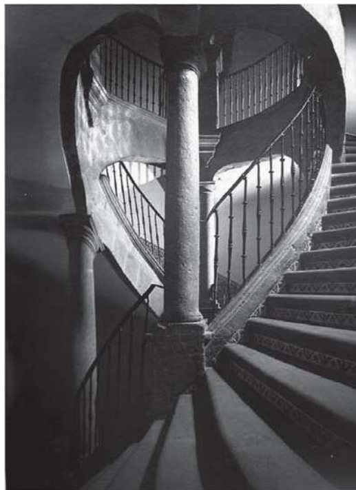
Detalle actual escaleras Casa de los Condes de San Mateo Valparaíso.

De acuerdo con el plano de Marquina, es el centro geográfico del recinto ceremonial Tenochca, correspondiente a la intersección entre el eje norte-