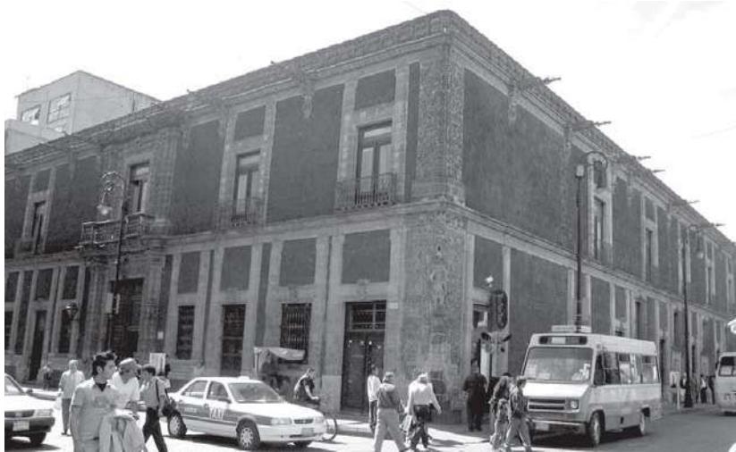
Archivo Histórico del Distrito Federal.