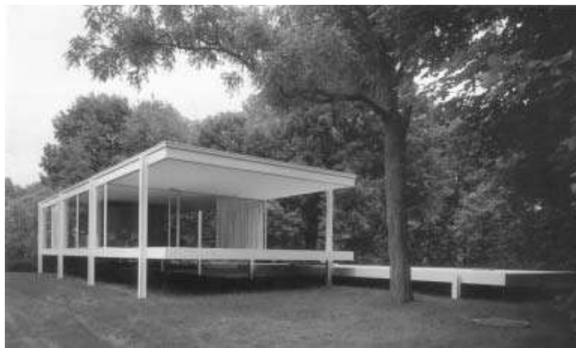
Casa Edith Farnsworth ubicada en Plano, Illinois.