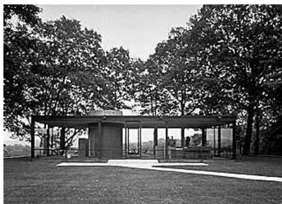
Casa de cristal, Cannan Nuevo, Ct.

Contrario a lo que aparenta este movimiento arquitectónico, éste ya tiene historia y presencia; basta ver y analizar algunas de las obras más represen-