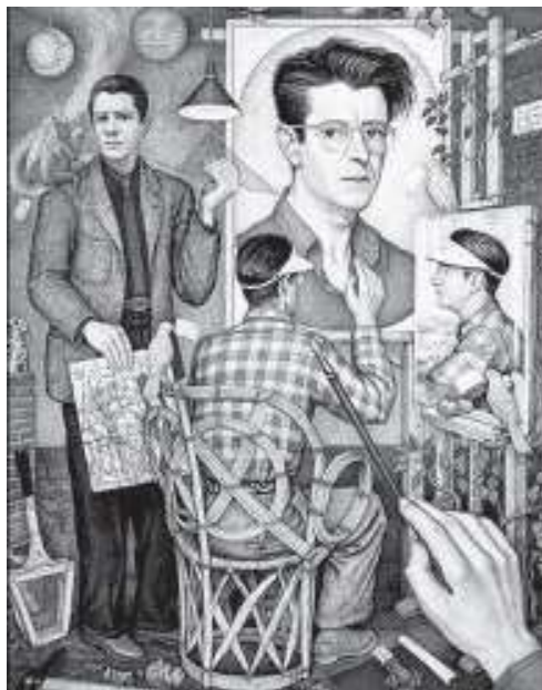
Autorretrato múltiple, Juan O'Gorman, 1950.

O'Gorman menciona en sus escritos que Narciso Bassols lo invita a trabajar en 1932, a lo largo de tres años, en el diseño de los edificios escolares, principalmente de educación básica, que serían conocidos como las "escuelas del millón" según palabras del mismo O'Gorman.