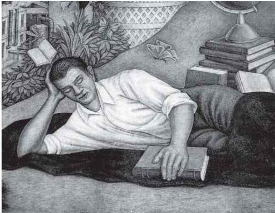
Detalle del mural El crédito transforma a México .

Vargas Salguero, Ramón. «El funcionalismo socialista, su promotor y su realizador». En: Escuelas Primarias 1932 , México.