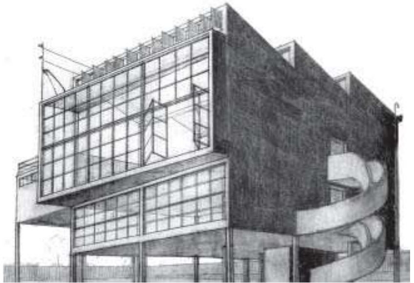
Casa-estudio Diego Rivera, (1931).

La teoría funcionalista radical se concentró más en el cumplimiento de la función a través de una