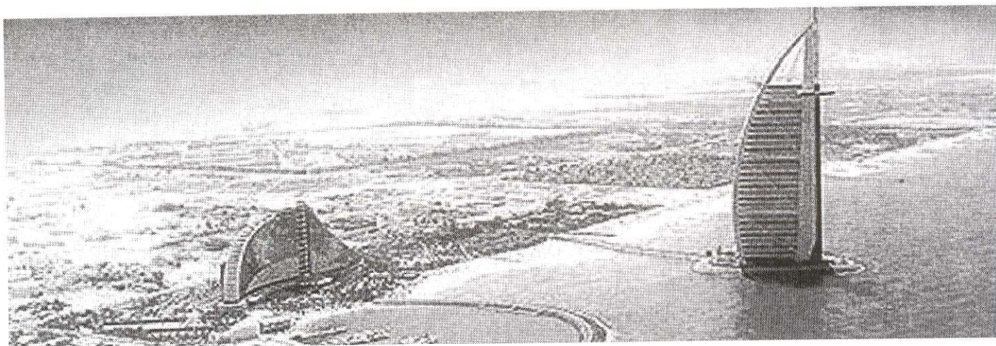
La isla donde se ubica el hotel también fue construida.

El Burj al Arab cuenta con 202 suites de lujo con un servicio enteramente personalizado para cada viajero, en el que destacan las recepciones privadas en cada planta y una organizada brigada de mayordomos. Todas las suites están equipadas con la última tecnología, ordenadores y acceso a Internet. Luces, cortinas y aire acondicionado en todas las habitaciones pueden manejarse desde un mismo control remoto que también sirve para escoger dentro de la más amplia selección de canales de televisión. Dentro de las suites, el hotel tiene 142 habitaciones de lujo, 18 suites pa-