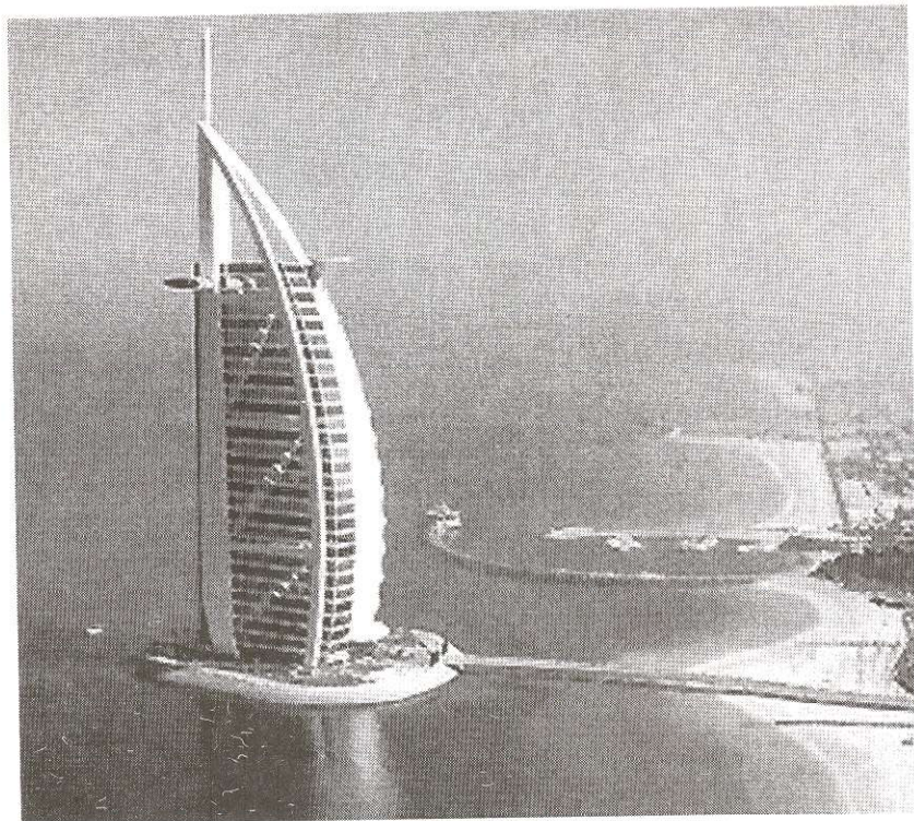
Los materiales con los que se construyó son los más exquisitos encontrados en el mundo.

Las tradiciones árabes y la hospitalidad más exquisita son pilares en el árabe Burj al Arab , y es un punto de referencia en Dubai como la Torre Eiffel es en París ☺