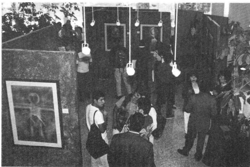
Panorama de la exposición.