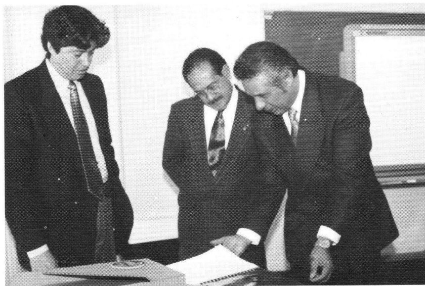
Exitosa terminación de los proyectos Pemex III y IV.

allá de lo que en determinado momento es el estándar de trabajo".