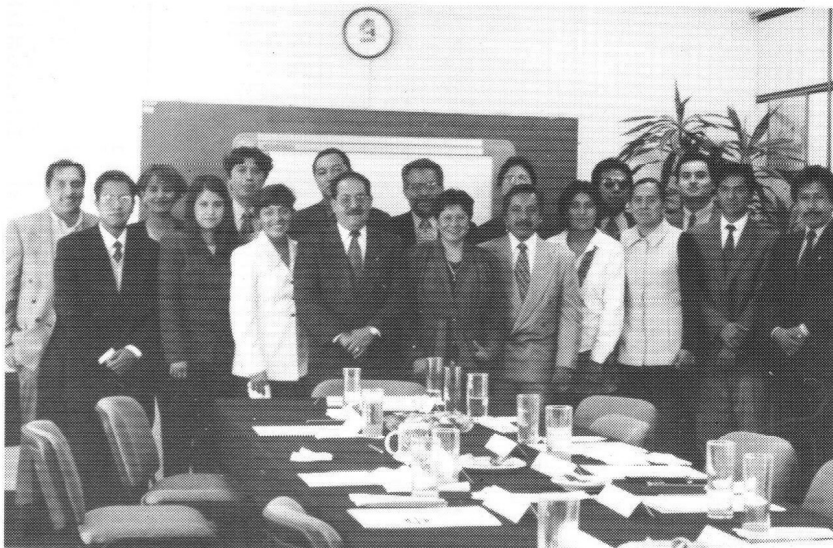
Alumnos, profesores y autoridades de ESIA Tecamachalco, demostraron profesionalismo y responsabilidad.

Durante la entrega de los dos proyectos, los funcionarios de Pemex destacaron que el Instituto Politécnico Nacional demostró "que si un frente no puede avanzar, existe una escuela hermana que responde a los retos y que continúa hasta llegar a la meta, demostrando que autoridades, alumnos y maestros están dispuestos a dar más