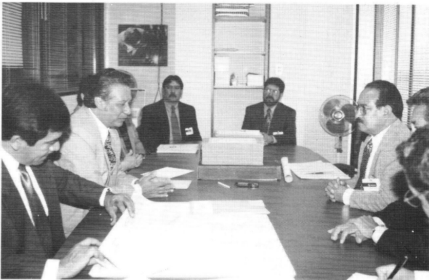
Autoridades de Pemex señalaron que dichos proyectos darán seguridad jurídica a los inmuebles de la paraestatal.