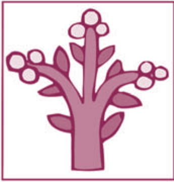
CEPROBI - IPN

EL COLEGIO DE PROFESORES DEL CENTRO DE DESARROLLO DE PRODUCTOS BIÓTICOS CONVOCA A TODOS LOS MIEMBROS DE LA COMUNIDAD A PARTICIPAR EN EL PROCESO DE ELECCIÓN DE LA TERNA QUE SERVIRÁ PARA LA DESIGNACIÓN DEL TITULAR DE LA SUBDIRECCIÓN ADMINISTRATIVA DE NUESTRA UNIDAD ACADÉMICA BAJO LOS SIGUIENTES