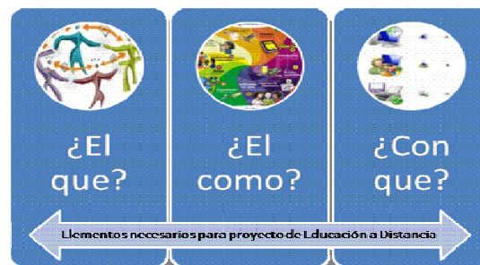
Figura 1. Los elementos principales en el proyecto de EaD.

Además que cuando se estudia la factibilidad de realizar un proyecto de EaD es muy importante tener conocimiento de que factores son necesarios para ello. (Mauri, 2000), que se observan en la figura 1.