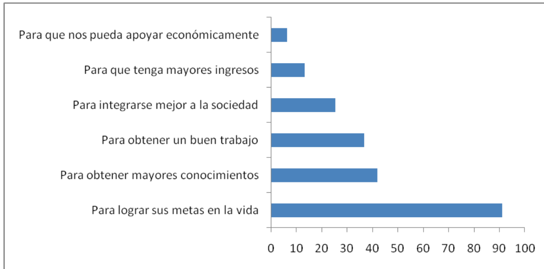
Gráfico 1. Importancia de la educación superior