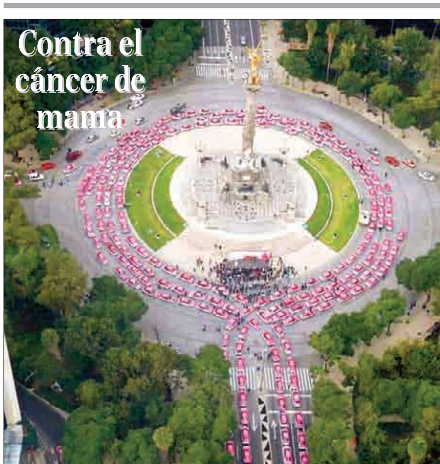
Cerca de 350 taxistas formaron con sus autos un lazo rosa alrededor del Ángel de la Independencia, en reconocimiento a la labor de la Fundación de Cáncer de Mama (Fucam).

No estén a la espera de reformas o cambios para actuar; hay que trabajar, dice durante la clausura de la Conferencia Anual de Municipios