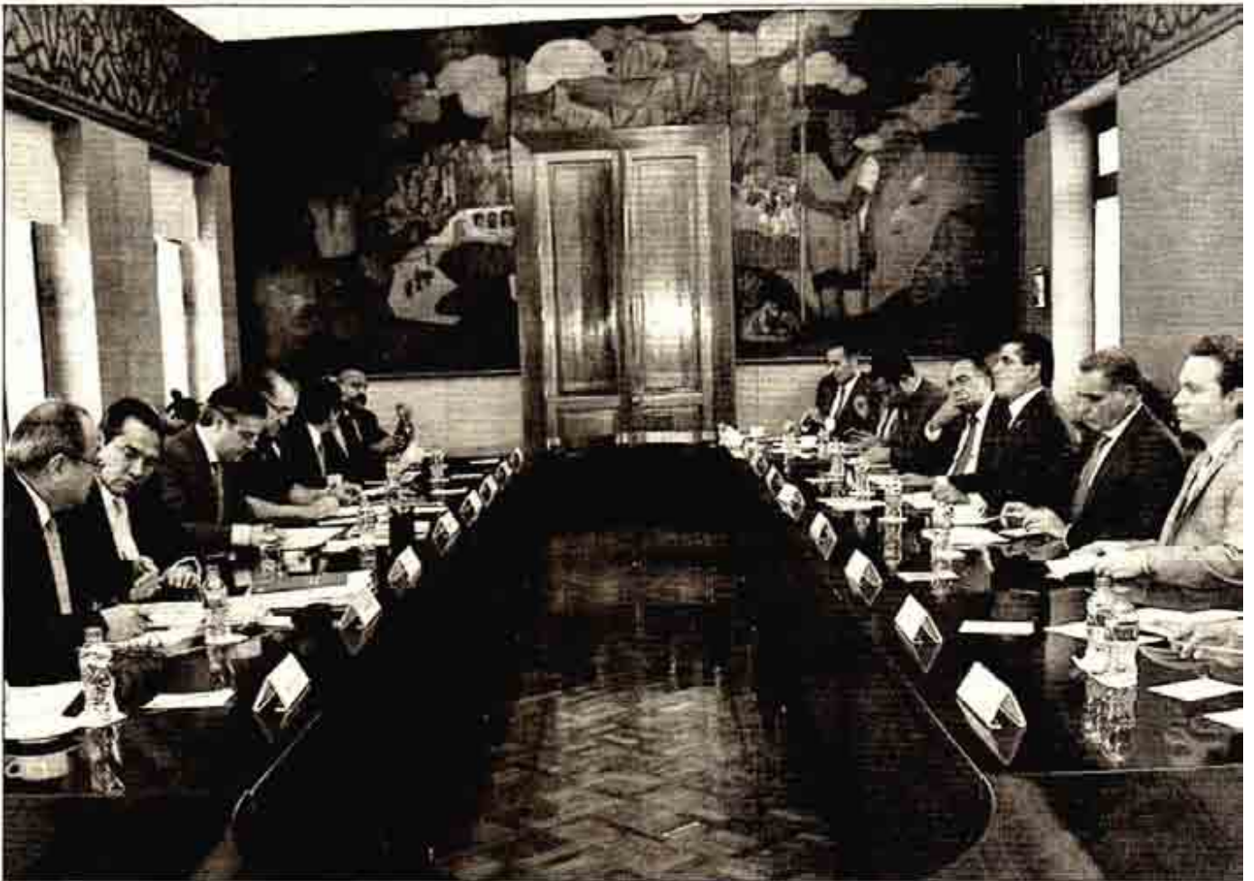
El titular de la SEF se reunió con los gobernadores de Chiapas, Oaxaca, Guerrero y Michoacán para revisar avances y fortalecer las estrategias de aplicación de la reforma educativa