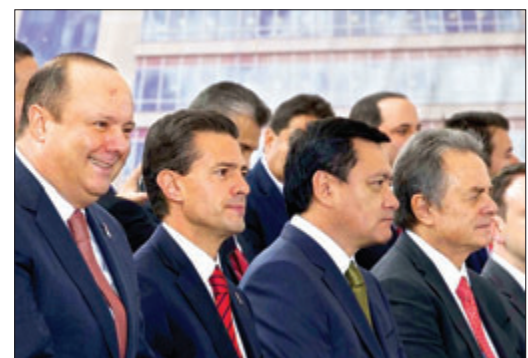
César Duarte, Enrique Peña Nieto, Miguel Ángel Osorio Chong y Pedro Joaquín Coldwell.

■ "No se vale nadar de muertito", pretextando falta de recursos o capacidades, reconviene a presidentes municipales, y les ofrece alianza permanente con el gobierno de la República