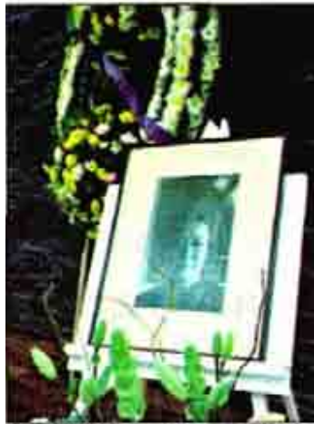
La académica y activista por los derechos de las mujeres falleció ayer en el DF

■ La académica del Colmex fue pionera en los estudios de género en el país e Iberoamérica