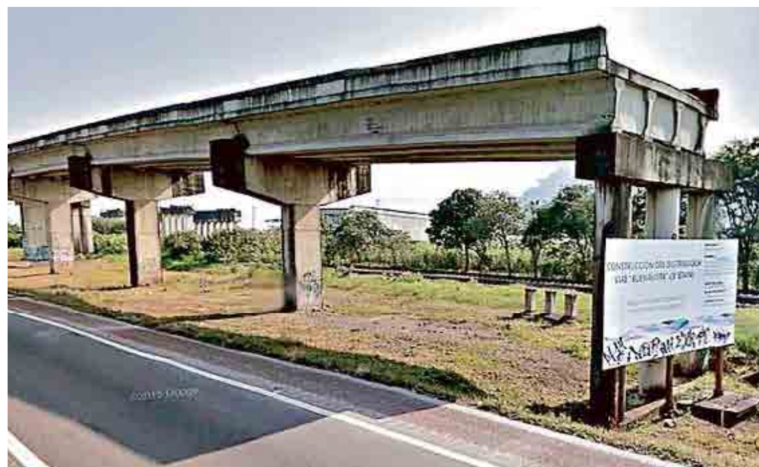
Aspecto del distribuidor vial Buena Vista, obra supuestamente terminada