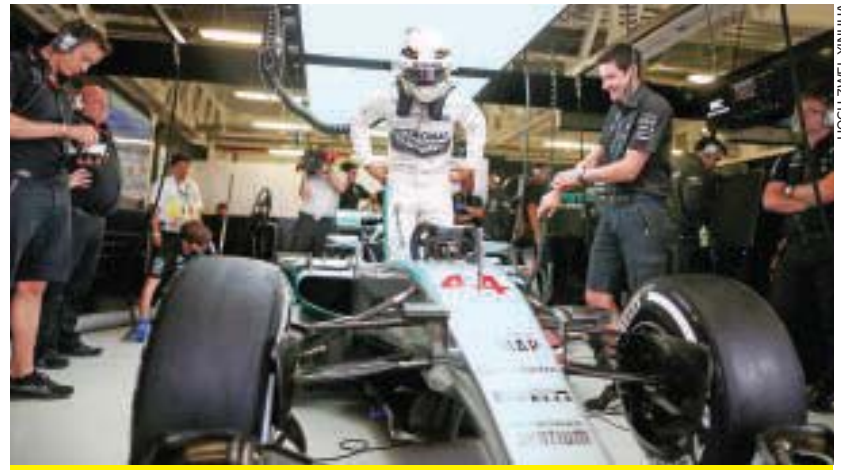
El piloto británico Lewis Hamilton, de la escudería Mercedes, durante la primera sesión de prácticas libres para el Gran Premio de México.