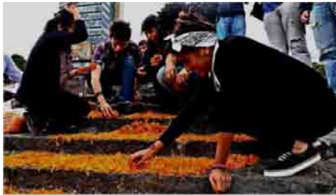
■ Otra ofrenda fue colocada por estudiantes de Filosofía, en ella se leía la leyenda elaborada con flores "Fue el Estado".