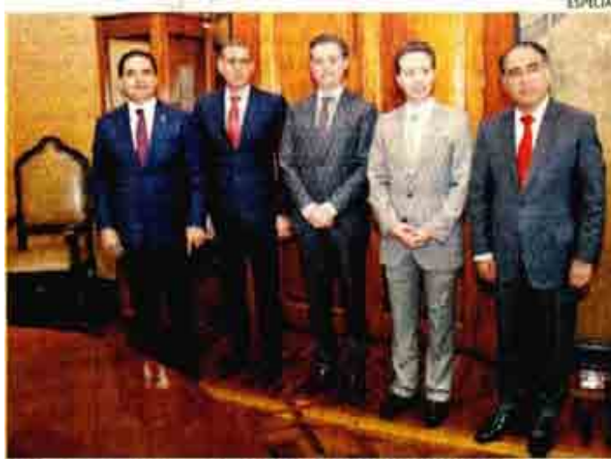
El secretario con mandatarios de Michoacán, Oaxaca, Chiapas y Guerrero.