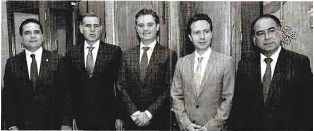
LOS GOBERNADORES de Michoacán, Guerrero, Chiapas y Oaxaca, Silvano Aureoles, Héctor Astudillo, Manuel Velasco, y Gabino Cué, respectivamente, mantuvieron una reunión con el secretario de Educación Pública, Aurelio Nuño, a fin de impulsar los programas establecidos para la transformación de la educación en México.