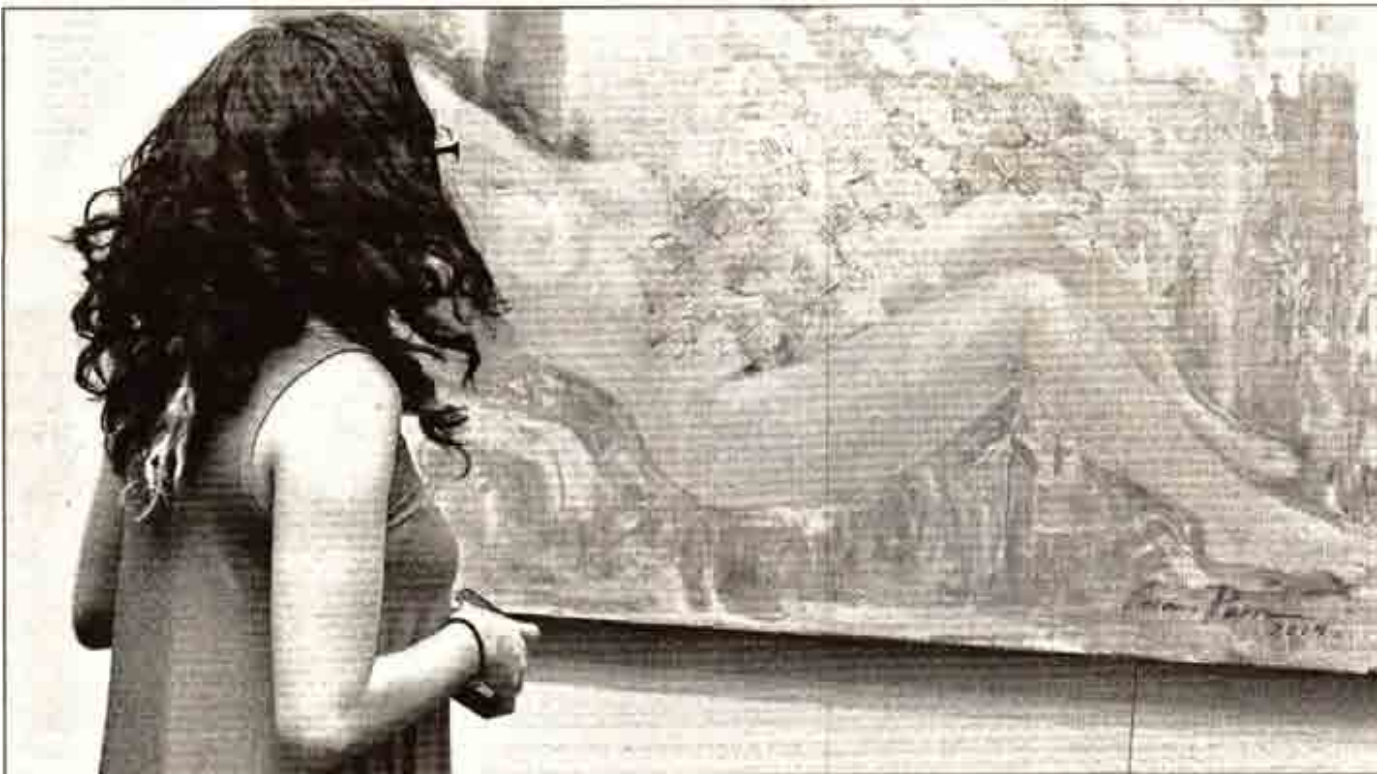
Lienzo de Carmen Parra con el tema de Dánae, donde el polvo de oro enviado por Zeus es sustituido por las alas de los lepidópteros que cada año migran de los lagos de Canadá a México en un recorrido de 4 mil kilómetros hasta llegar a los bosques de oyameles de los estados de México y Michoacán. La muestra de la artista se puede visitar en Universum Museo de las Ciencias, en Ciudad Universitaria