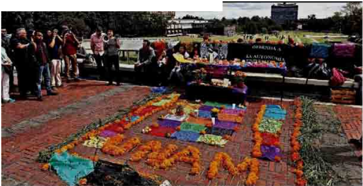
Durante un mitin fue instalado un altar a unos metros del acceso a la Torre de Rectoría, sin obstruir la entrada.

En el olvido quedaron una decena de altares formados con flores de cempasúchil consagrados a los muertos por las causas sociales, mientras la Junta de Gobierno inició, a puerta cerrada, el cónclave para designar al nuevo Rector o a la nueva Rectora.